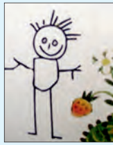
Lerngarten der KITA Ev. Friedensgemeinde

Die Idee entstand im Floratrium, gefunden haben Christel Tegge und Katja Börsch ihren Kinder»Garten« schließlich im Fährweg. Seitdem wandern sie oft vormittags mit den Kleinen den schönen Weg über die Weser, um hautnah zu erfahren, was wann wie in der Natur alles wächst. Querbeet wird gebuddelt, gestaunt, gespielt und mit Freude geerntet – die Ausbeute verwandelt sich dann in der KITA-Küche zu leckerem Essen. So bekommen auch die Stadtkinder eine bewusste Verbindung zur Natur und erfahren, was saisonale und regionale Nahrung ist.